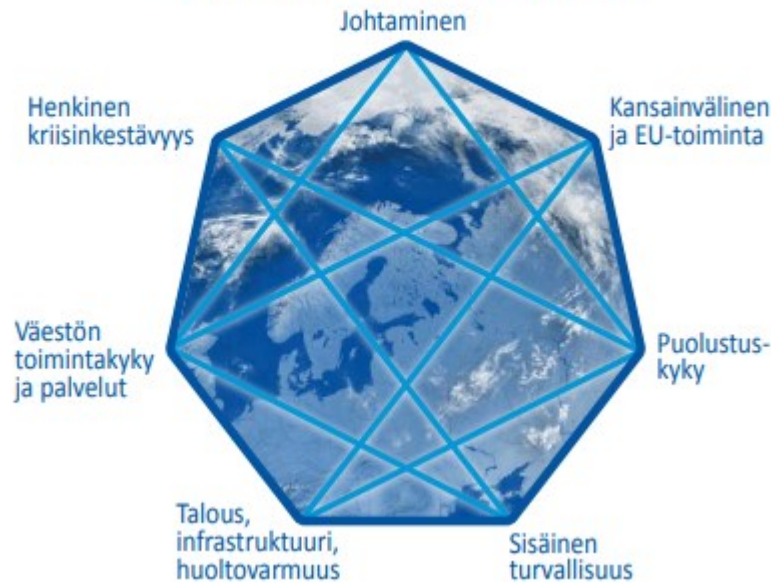
Kuva 2. Yhteiskunnan elintärkeät toiminnot; YTS 2017

Yhteiskunnan elintärkeät toiminnot. YTS 2017 Yhteiskunnan elintärkeät toiminnot on kuvattu tarkemmin Yhteiskunnan turvallisuuden strategiassa 2017 ( Elintärkeät toiminnot 3. ). Elintärkeät toiminnot ovat lähtökohta varautumisen suunnittelulle kaikilla toimintatasoilla. Niiden turvaamiseksi suunnitellaan riskiarvioon pohjautuvat käytännön tehtävät ja vastuut. Valtioneuvostotasolla elintärkeiden toimintojen turvaamiseen on määritelty hallinnonalojen strategiset tehtävät, jotka kuvataan vastuuministeriöittäin